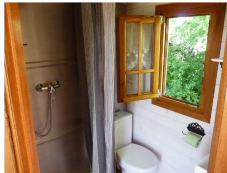
Sanitaires : lavabo, WC, douche. Fenêtre.