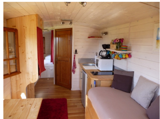
Coin cuisine : 2 plaques vitrocéramiques, micro-ondes, évier 1 bac, frigo 112 litres, grille-pain, cafetière, mixer, bouilloire, autocuiseur.